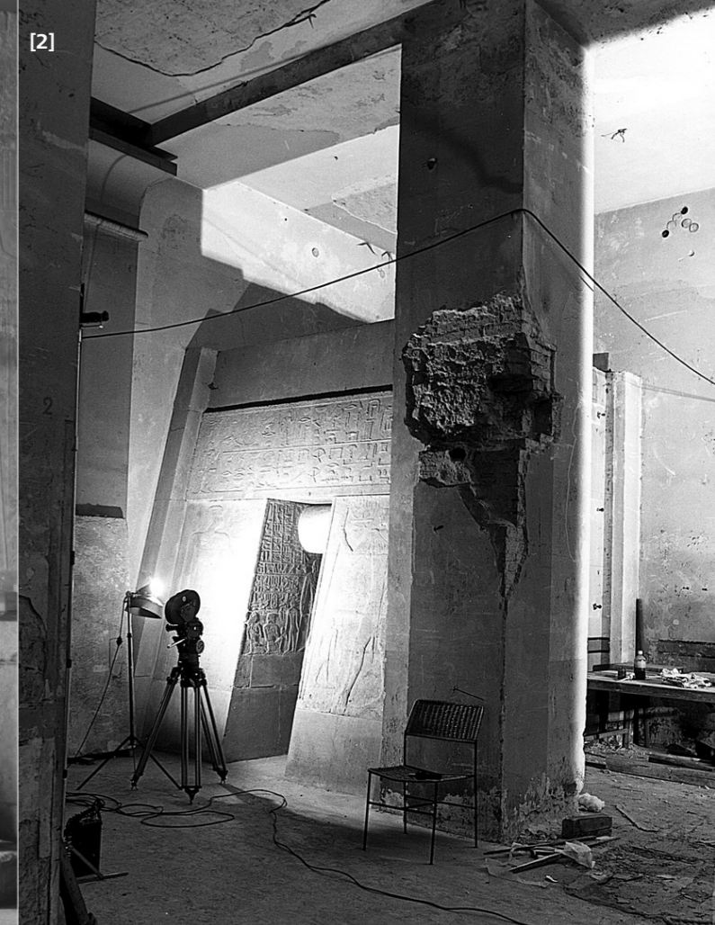
[1] Cámara de ofrendas de Manofer. La presentación se había modificado para mostrar las paredes como una composición continua.